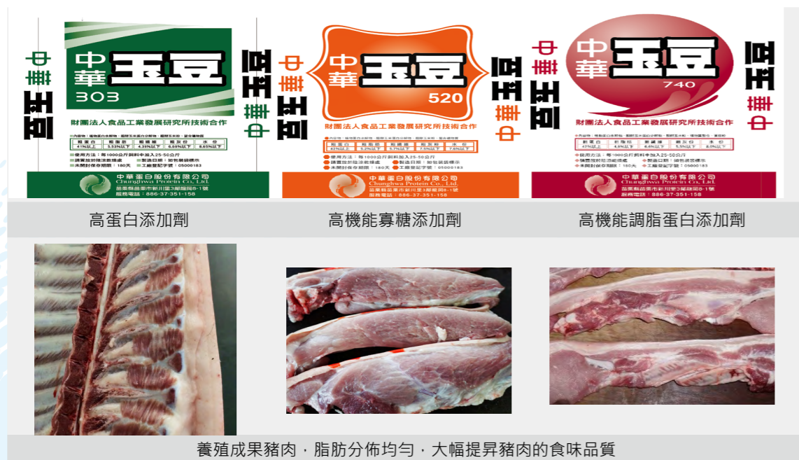
養殖成果豬肉，脂肪分佈均勻，大幅提昇豬肉的食味品質

中華蛋白飼料調控技術所生產之豬肉具有軟嫩、多汁、風味鮮甜等品質特性，簡單烹調即可品嚐到豬肉的好滋味，亦適合開發成各式調理肉品。